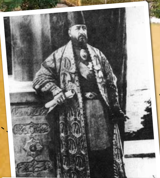
عکسی از امیر کبیر