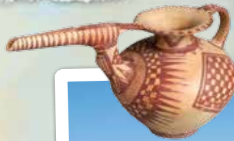
▼ تپه‌ی سیلک و کوزه‌ی باستانی

کاشان همواره یکی از شهرهای مهم ایران بوده است. در گذشته‌های خیلی دور، در منطقه‌ای از کاشان به نام سیلک، شهری آباد وجود داشت. آثار و بقایای کشف شده از سیلک شگفت‌انگیز هستند. کوزه‌ها و اشیای سفالی و فلزی که در آنجا یافت شده‌اند، نشان می‌دهند که اهالی سیلک علم و دانش زیادی داشته‌اند.